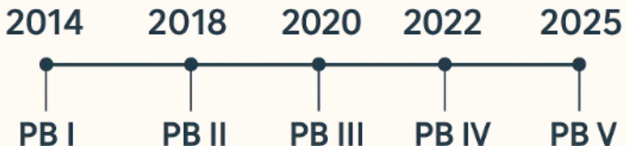
Tabla – Edificios Pacheco Boulevard (I a VI)