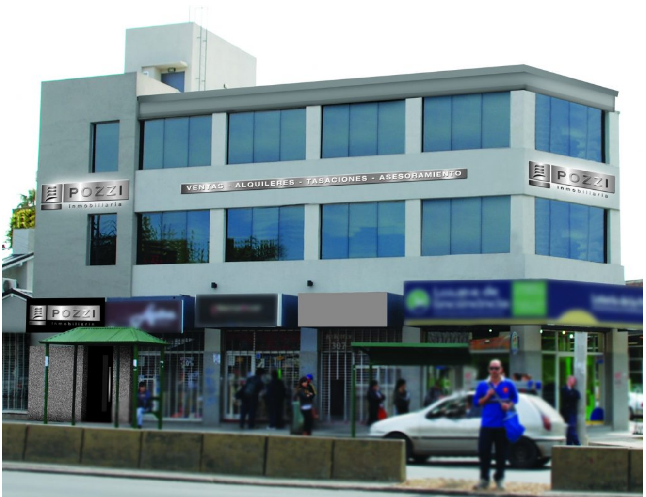
Arriba, y abajo a la izquierda: las primeras oficinas. Abajo a la derecha: sobre ese mismo terreno se construyó el edificio